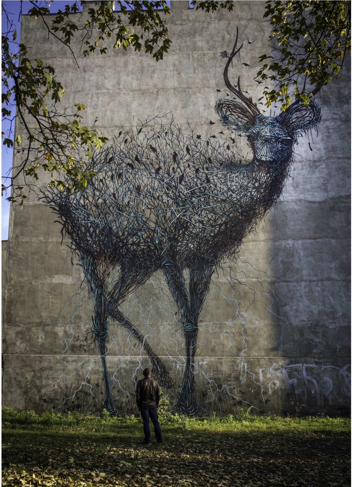
ŁÓDŹ ul. Łąkowa 10